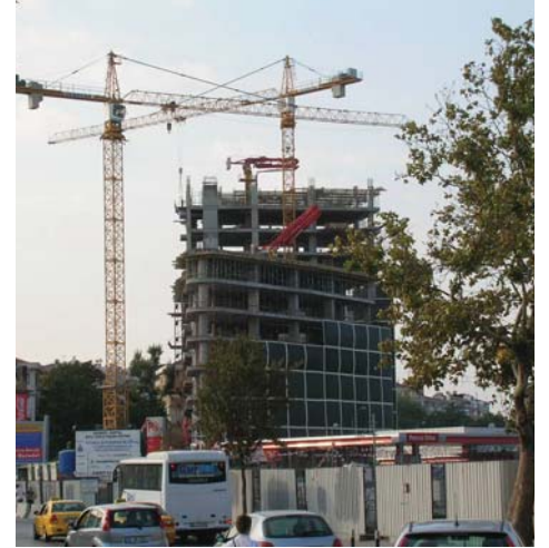
Corner Otel İnşaatı

Taşyapı'nın, Kadıköy'ün merkezinde, tüm Kadıköy'e ve deniz manzarasına hakim olarak konumlanan Corner Otel projesi, Atkins Limited tarafından 250 oda kapasiteli, 5 yıldızlı otel olarak tasarlandı. Otelin birinci ve zemin katlarında otel müşterilerine ve aynı zamanda dışarıya hizmet verecek cafe ve restoranların,