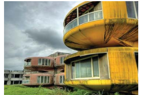
San Zhi

Gunkanjima, Nagazaki'den 15 km uzaklıkta bir ada. Japon Nagazaki Yönetimi'ne bağlı ve üzerinde yerleşim olmayan 505 adadan biri olan Gunkanjima, 1887 - 1974 yılları arasında aktif olan kömür madenleri nedeniyle girdiği hızlı gelişim süreciyle dikkat çekiyor. Bu sürecin kömürün bir endüstriyel hammadde olarak önemini yitirmesiyle aniden durması ve üzerinde yükselen kale duvarları nedeniyle "Savaş Gemisi Adası" olarak da bilinen Gunkanjima'yı "hayalet ada" haline getirmesi ise adanın bu listede yer almasının sebebi. 1890 yılında Mitsubishi firmasının adayı satın alıp deniz dibinden kömür çıkartmaya başlaması, Gunkanjima'ya olan ilginin giderek artması ve 1916 yılında Japonya'nın ilk büyük beton binasının burada inşa edilmesiyle sonuçlandı. Yapı, adadaki maden işçilerinin ikamet etmesi ve aynı zamanda tayfunlardan korunması için geliştirilen iki apartman bloğundan oluşuyordu. 1959 yılında nüfus, adanın tamamında her hektara 835 kişi, yerleşimin olduğu bölümünde ise her hektara 1.391 kişi düşecek şekilde arttı. Dünyada kaydedilmiş en yüksek nüfus yoğunluğu oranlarından birine sahne olan Gunkanjima'daki kömür madenlerinin önemi, tüm dünyada olduğu gibi Japonya'da da petrolün 1960'lı yıllarda kömürün yerini almasıyla azalmaya başladı. 1974 yılında firmanın madenleri kapatacağını açıklamasından sonra ise tamamen terkedilen